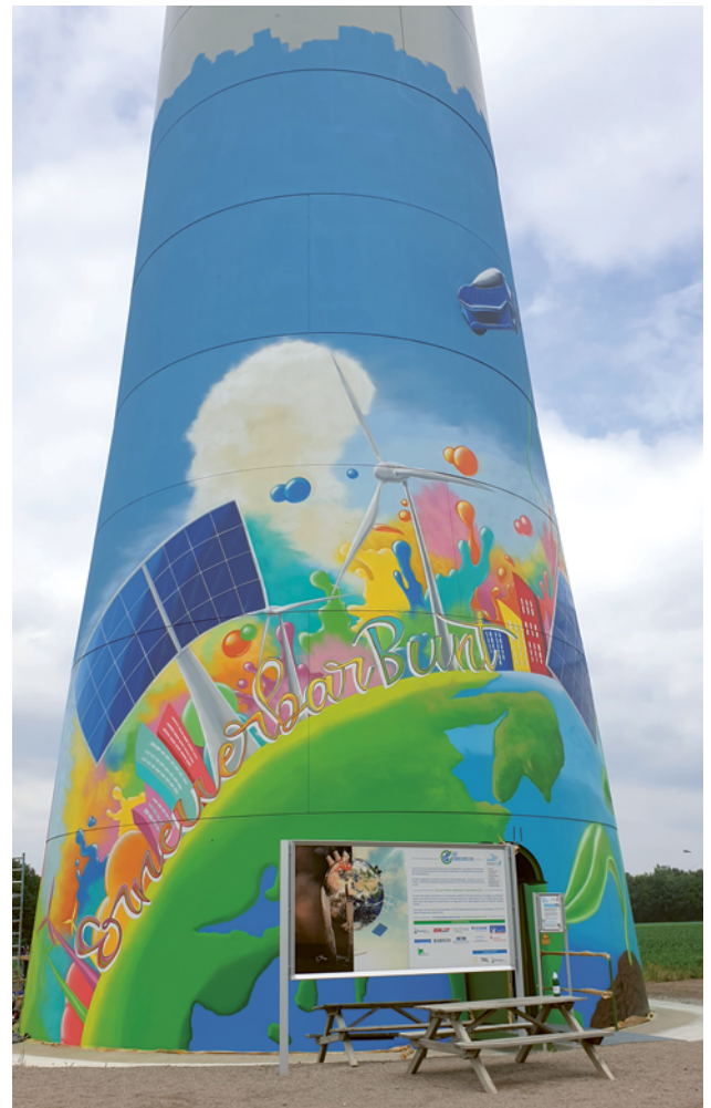
Bürgerwindanlage mit Ausstellung und Graffiti im Bürgerwindpark A31 Hohe Mark

Seit dem 1. Mai 2017 führt die Bundesnetzagentur Ausschreibungen zur Ermittlung der finanziellen Förderung von Windenergieanlagen an Land durch, an denen sich auch Bürgerwindprojekte beteiligen können. Windenergieanlagen von Bürgerenergiegesellschaften im Sinne des § 3 Nr. 15 EEG bis zu einem Leistungsumfang von 18 Megawatt (MW) können seit dem Jahr 2023 8 von der Teilnahmepflicht an Ausschreibungen befreit werden. Stattdessen erhält die Bürgerenergiegesellschaft eine gesetzlich festgelegte Vergütungshöhe für den erzeugten Strom.